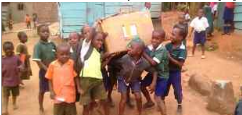
Stor glädje bland skolbarnen på Katumba i Uganda. En stor sändning med pedagogiskt material bekostat av HumanistHjälpens donatorer. Dagarna därefter stängdes alla skolor i landet. Nu står materialet och väntar på barnen.