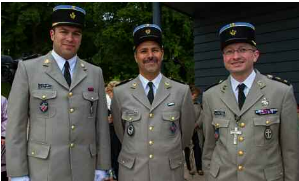
Fältrabbin, fältimam och fältpräst i franska försvarsmakten.

1. Var är den sekulära humanismen? Enligt den senaste attitydundersökningen från Myndigheten för ungdoms- och civilsamhällesfrågor (2019) uppger 61 % av unga (16-29 år) att de inte är troende. Det här innebär att den nuvarande majoriteten av de som ska göra värnplikt eller ta anställning som soldater inte har någon som helst nytta av inne-